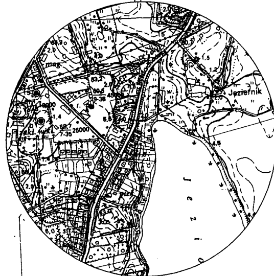
Szkic orientacyjny skala 1:10000

Biuro Usług Nieruchomości MAPA Jerzy Zajdlc ul. Miedzychódzka 100 Miedzychód tel. 784 52 24, kom. 0601 794 511 NIP 505 222 24 REGON: 210-528-508