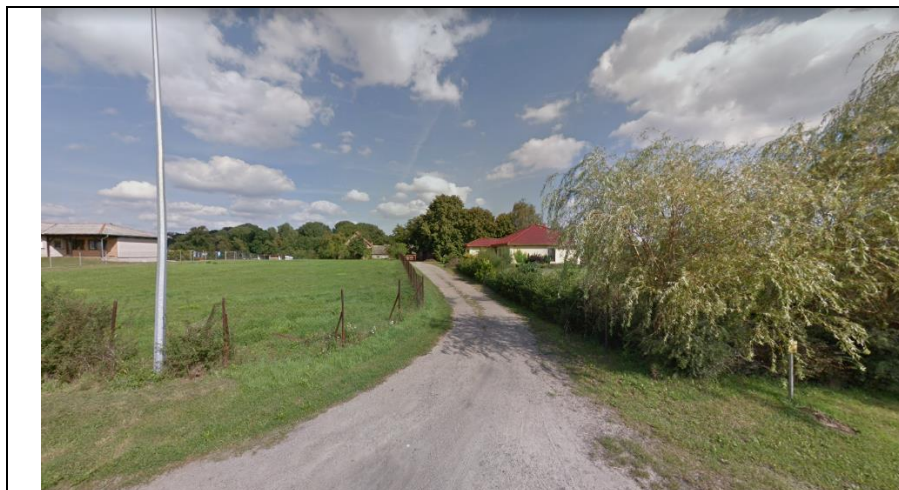
Fot. 1. Widok na ul. Wierzbową z ul. Trzcielskiej