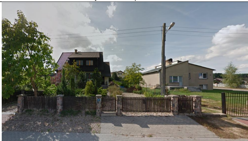
Fot. 4. Widok na zabudowania od strony wschodniej osiedla