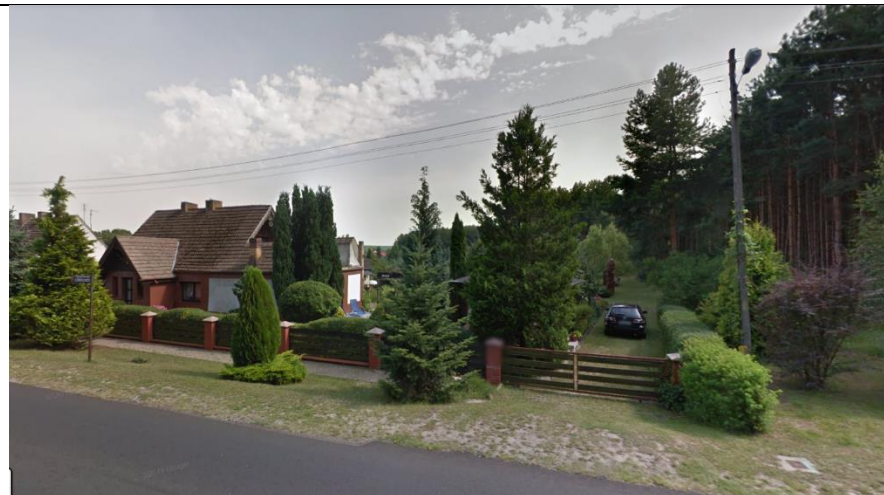
Fot. 6. Widok na teren opracowania od strony północno-zachodniej