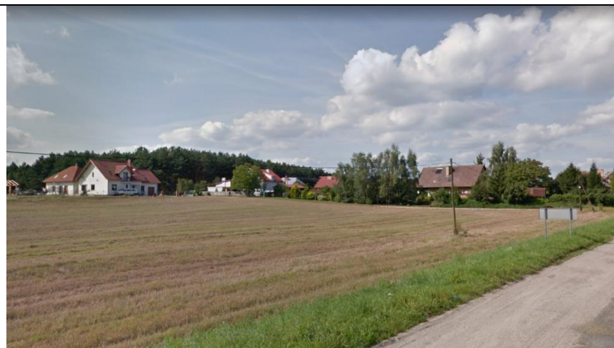
Fot. 2. Widok z ul. Trzcielskiej na teren opracowania