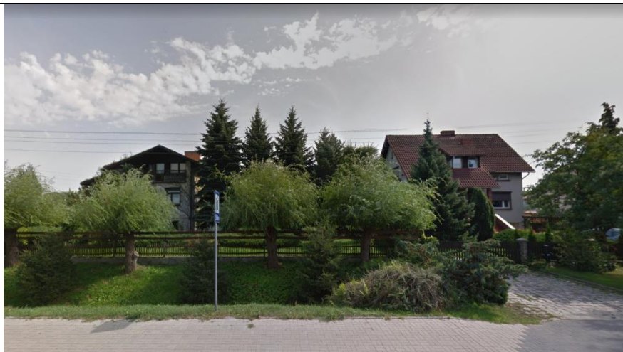
Fot. 5. Widok na teren opracowania od strony ul. Międzyrzeckiej