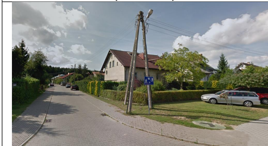
Fot. 3. Widok na osiedle od strony południowo-wschodniej